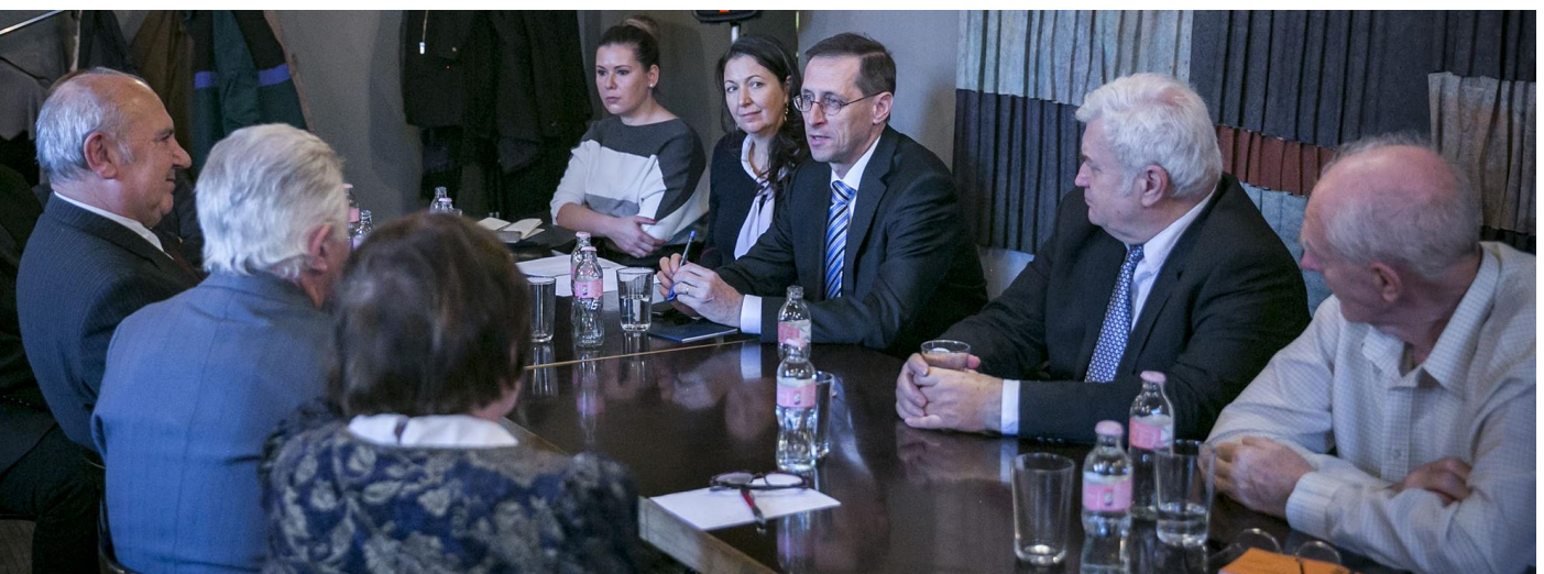
Szokásos budapesti összejöveteli helyszín évtizedekig az Építész Pince volt