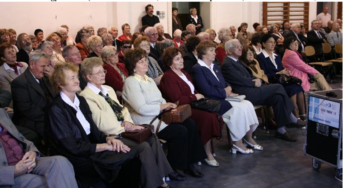
Évente hagyományos karcagi összejövetel